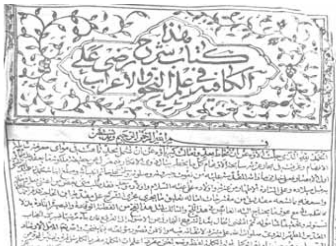
Şəkil 1. "Şərhu Radi alə əl-Kafiyə fi ilmin nəhv və irab" əsərinin I hissəsinin ilk səhifəsi

Orta əsrlərdə səhifələmə metodu paqinasiya üsulundan ibarət olduğuna görə kitaba səhifələr vurulmamışdır. Araşdırma zamanı vərəqlərin nömrələnməsi şərti olaraq bizim tərəfimizdən icra edilmişdir.